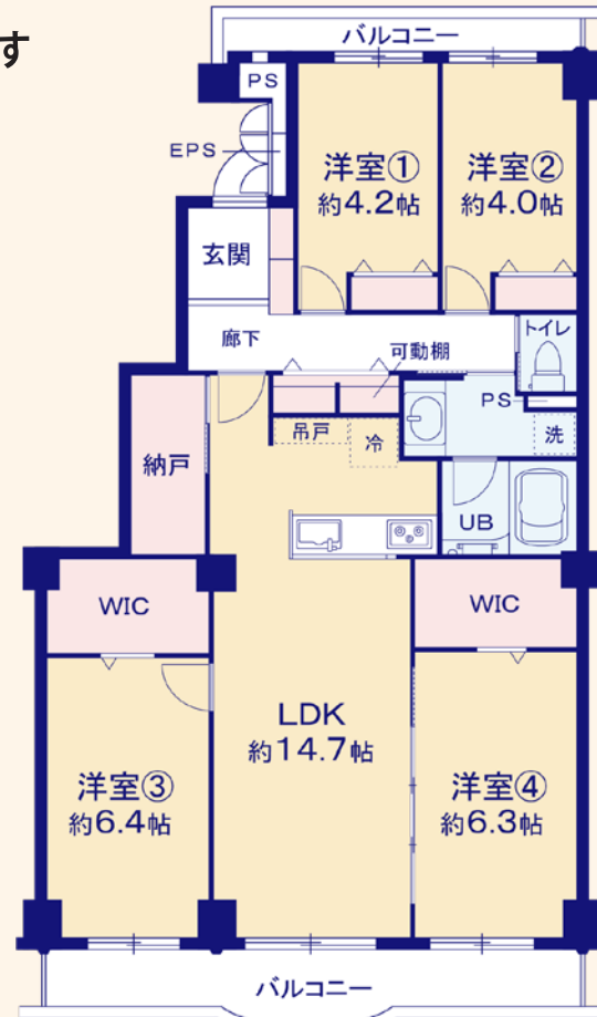
※WIC=ウォークインクローゼット